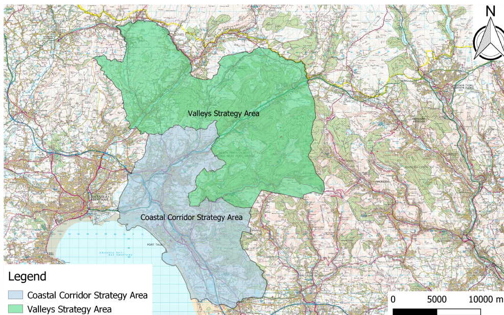
Ffigur 5.1 Ardaloedd Strategaeth CDLI CNPT

5.0.2 Mae CDLI CNPT yn cynnwys polisiau strategol ar sail ardal ar gyfer y ddwy ardal strategaeth: