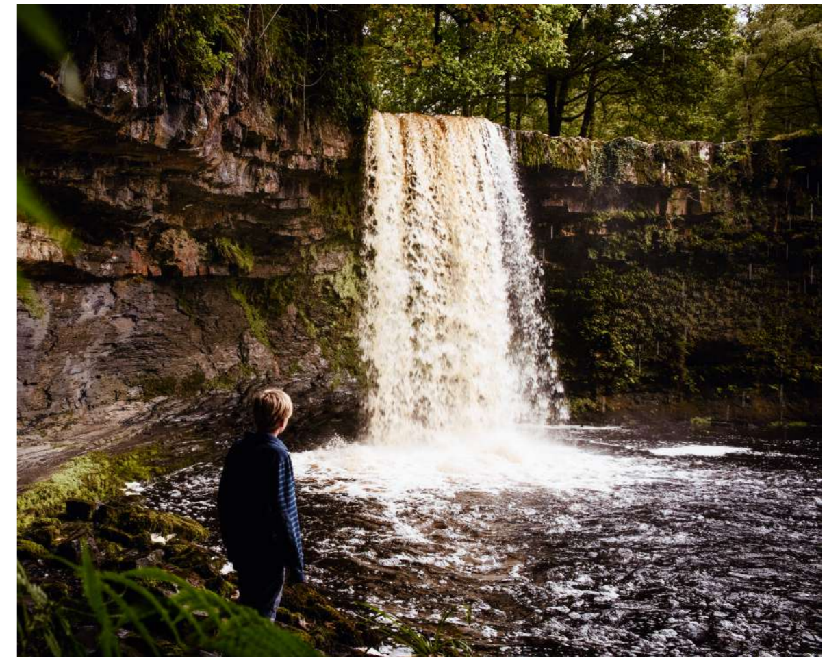
Nid yw'r cyfleusterau presennol i ymwelwyr yn creu porth digonol i Wlad y Sgydau.