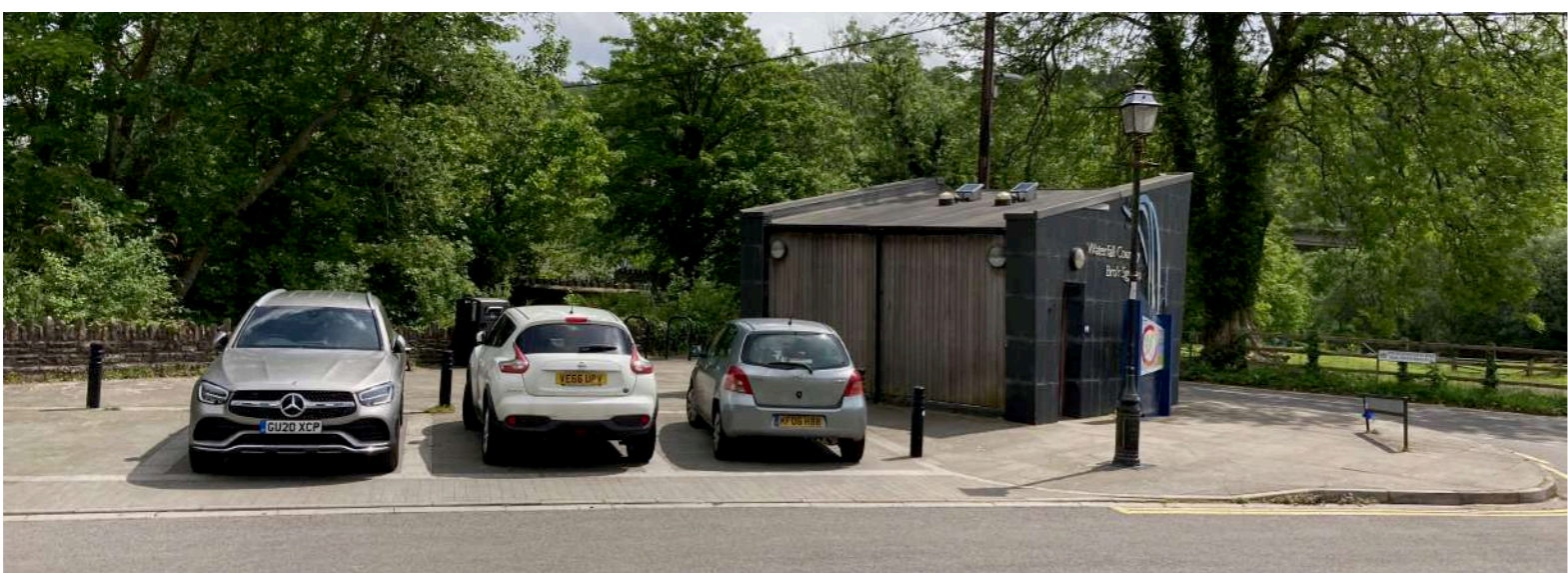
Parcio yw'r broblem amlcaf yn y pentref ar yr adegau prysuraf i ymwelwyr. Mae cilfan barcio ar hyd Heol Pontneddfechan ond nid oes palmant penodedig yno a rhaid i gerddwyr groesi'r ffordd rhwng y ceir. Mae 4 lle parcio di-dâl wrth ymyl y toiledau cyhoeddus cyfyngedig.