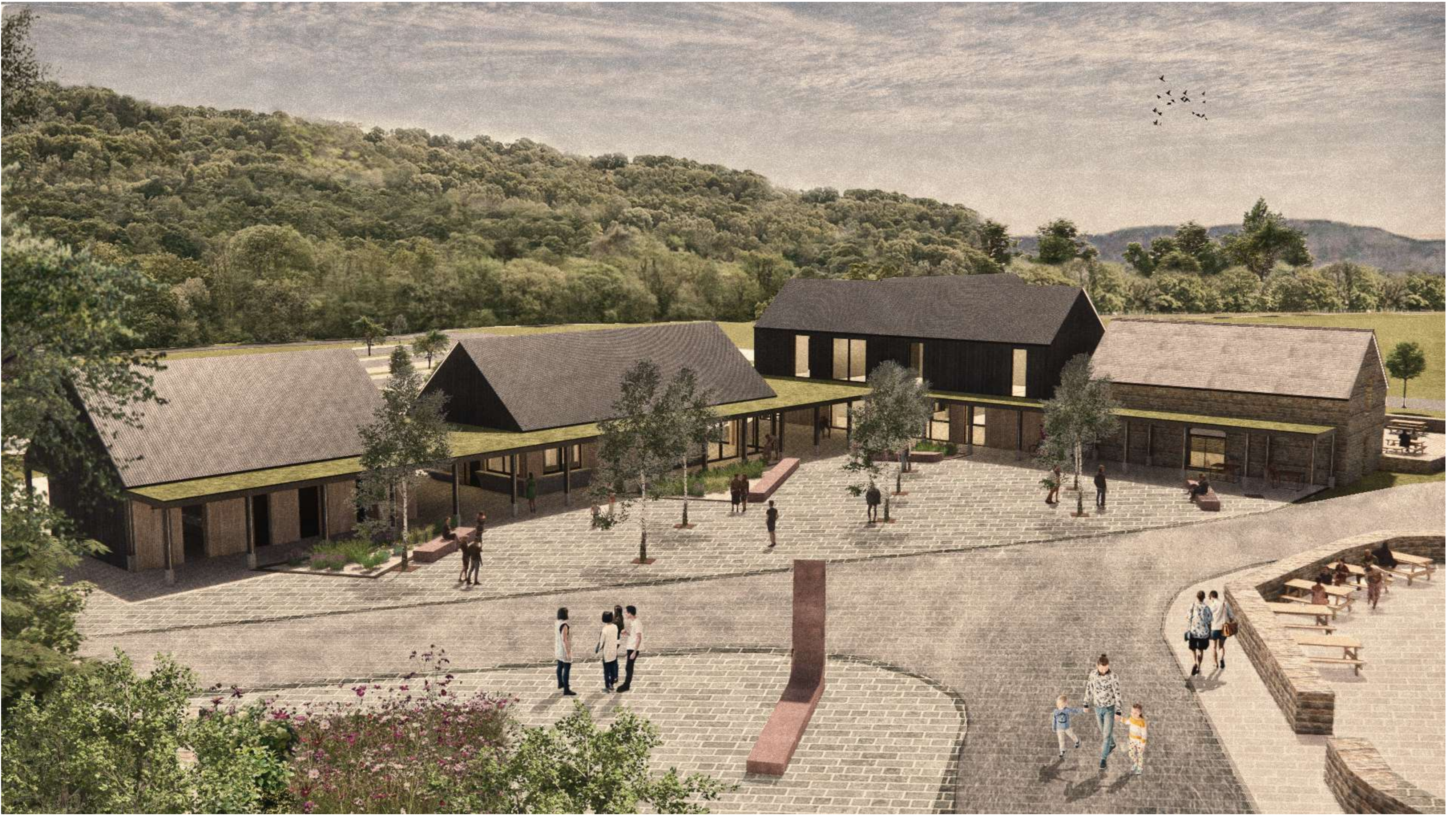
Trefnir yr elfennau adeileddig ar ffurf casgliad o adeileddau tebyg i ysguboriau â theon ar oleddf, wedi'u cysylltu gan golonâd allanol ysgafn a fydd yn darparu cysgod a chyfleoedd dehongli.