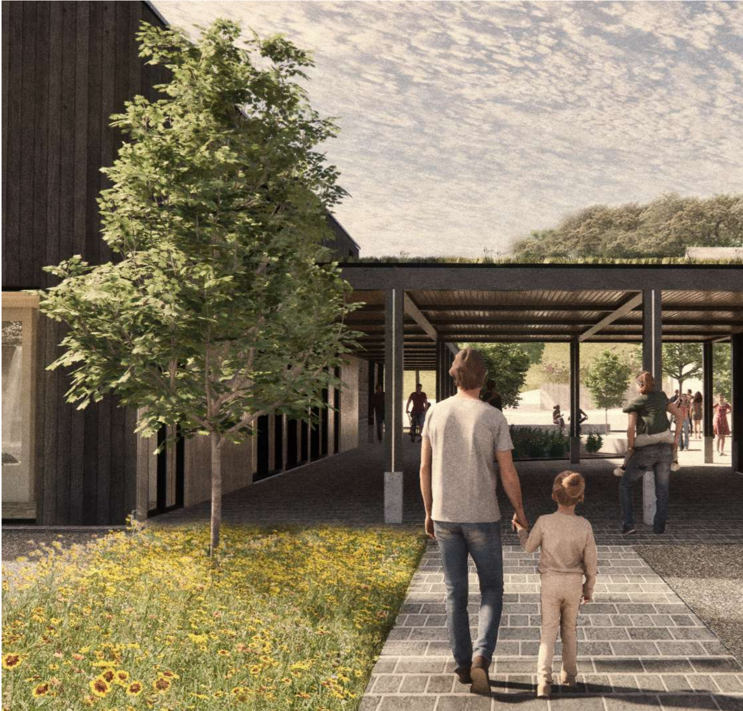
Mae bylchau rhwng yr elfennau adeileddig yn darparu pyrth i gerddwyr symud o'r ardal oedd parcio i sgwâr y pentref. Mae'r agoriadau hefyd yn cyd-reddeg â'r golygfeydd allweddol o'r maes parcio tuag at sgwâr y pentref neu o'r sgwâr tuag at gefn gwlad agored.

Mae'r Dadansoddiad o Gyd-destun y safle datblygu wedi llywio ymateb dylunio sy'n cynnwys: