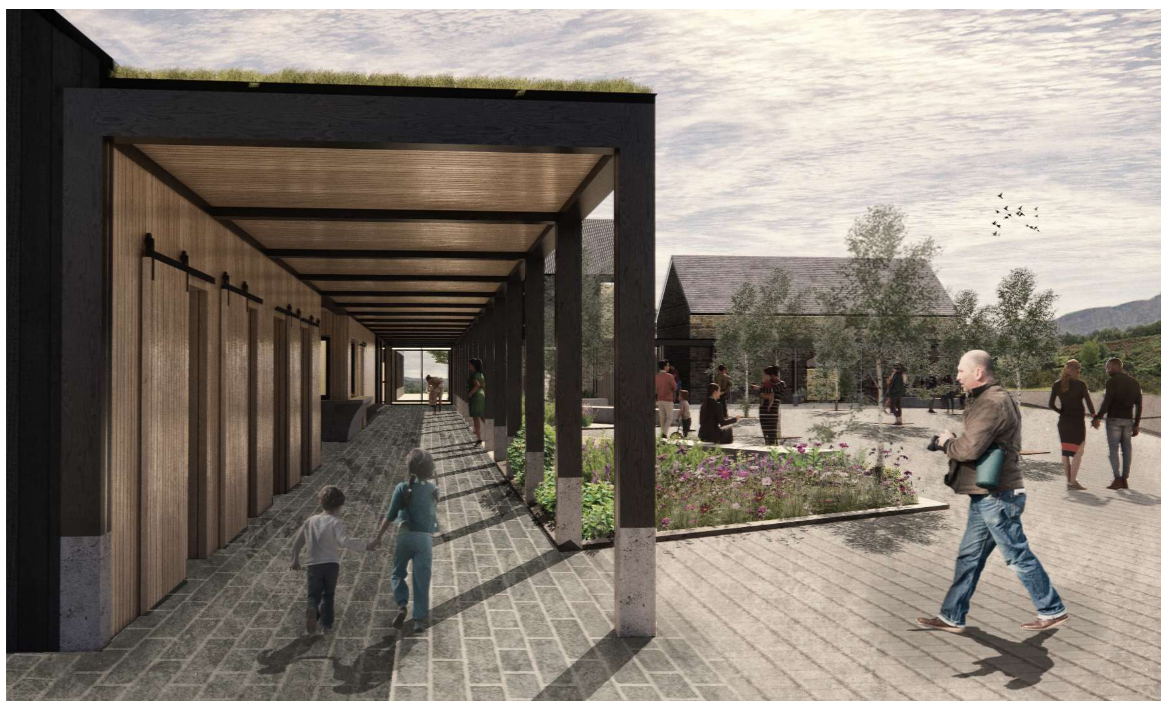
Yr olygfa ar hyd y colonâd sy'n ffurfio ymyl y sgwâr gyhoeddus

Cysylltir yr hwb a'r llety gan golonâd dan do sy'n darparu lloches a mannau ymgynnull, gan integreiddio gwybodaeth leol a gwybodaeth i ymwelwyr sy'n adrodd stori Pontneddfechan a Gwlad y Sgydau.