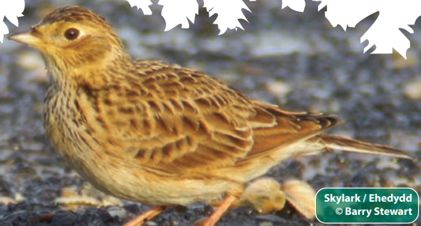
Skylark / Ehedydd

Am fwy o wybodaeth am gael mynediad i ardaloedd gwledig ac am hawliau tramwy, ewch i dudalennau cefn gwlad ein gwefan www.npt.gov.uk/countrysideaccess neu ffoniwch 01639 686868 . Am fwy o wybodaeth am fywyd gwylt yng Nghastell-nedd Port Talbot, ewch i www.npt.gov.uk/biodiversity neu ffoniwch 01639 686149 . I gael manylion am leoedd eraill i ymweld â hwy yng Nghastell-nedd Port Talbot, ewch i www.visitnpt.co.uk