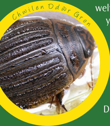
Chwilen Ddŵr Gron

Yn aml mewn gwlyptiroedd fe welwch bryfetyn mawr trwm, yn enwedig ar gloddiau'r ddraenen wen ar ddechrau'r gwanwyn. Dyma Bryfyn Sant Marc ( Bibio marci ), ac fe'i gelwir felly oherwydd ei fod yn ymddangos mewn pryd i Ddiwrnod Sant Marc, 25 Ebrill.