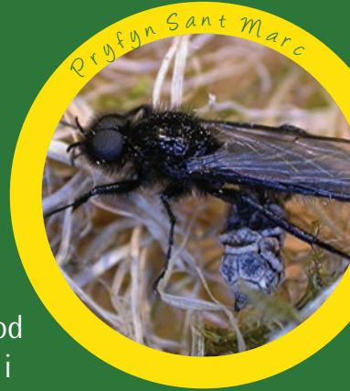
Bryfyn Sant Marc

Ar lannau pyllau dŵr a chamlesi ceir rhywogaethau arbennig sy'n hoff o ddŵr megis gweision y neidr a mursennod, sy'n gallu cyflawni campau hedfan anhygoel i ddal trychfilod hedegog eraill. Mae gennym tua 20 rhywogaeth o was y neidr, sy'n byw mewn pyllau