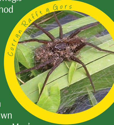
Corryn Rafft y Gors

Yn 2003, gwnaed darganfyddiad rhyfeddol yng Nghastell-nedd Port Talbot. Daethpwyd o hyd i boblogaeth o Gorynod Rafft y Gors ( Dolomedes plantarius ) ar lannau Camlas Tennant ym Mhant-y-Sais ger Pentre Caseg (Jersey Marine). Mae'r corryn yma'n brin iawn ac fe'i gwelir mewn dau fan arall yn unig yn y DU. Daethpwyd o hyd i'r corryn hwn wedyn yn uwch i fyny'r gamlas ac yng Nghors Crymlyn. Mae'r