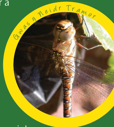
Gwas y Neidr Tramor

dŵr ac o'u cwmipas yn ardaloedd ucheldir, afonydd, ffeniau, coryydd a chamlesi Castell-nedd Port Talbot. Mae'r fursen ddeniadol Coenagrion Amrywiol ( Coenagrion pulchellum ) yn gyffredin ym Mhant-y-Sais, ac mae'r Gwas y Neidr Tramor ( Aeshna mixta ) yn aml yn ymweld â phyllau ar draws y Fwrdeistref Sirol.